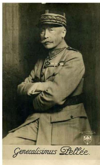
Deux portraits du général Pellé : à gauche, à la une du magazine «Le Pays de France » du 1 er mars 1917 ; à droite, photo officielle en tchécoslovaquie.